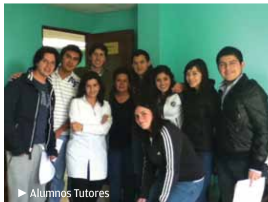
► Alumnos Tutores

Con la apertura del Centro Comunitario de Aprendizaje (CCA) en la comunidad de Tetelpan, Álvaro Obregón, nace una nueva oportunidad de estudio para los habitantes de la zona.